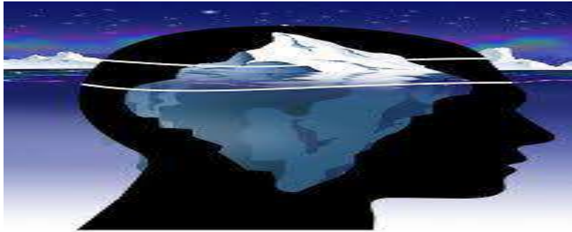
شكل رقم 01: نموذج يونغ للنفس البشرية على شكل جبل جليدي

من الجدير بالذكر أن كلا من العقل الواعي، اللاوعي الشخصي، واللاوعي الجمعي مترابطة معا وجميعها تلعب دورا مهما في كيفية اختبارنا للحياة وعيشها.