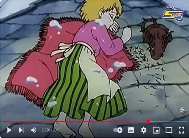
ج . الصورة والألوان: الصورة 2