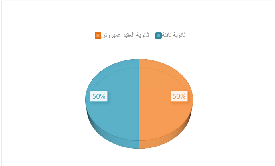
الشكل رقم (02): يوضح دائرة نسبية لخصائص العينة حسب عدد تلميذات في الثانوية