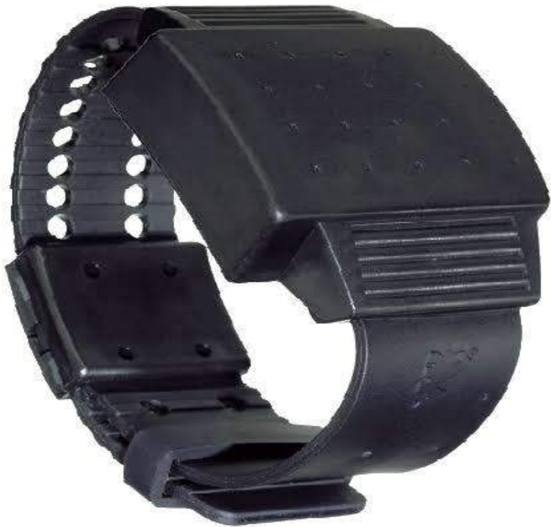
الصورة 3 الصوار الإلكتروني الذي يوضع في الرجل