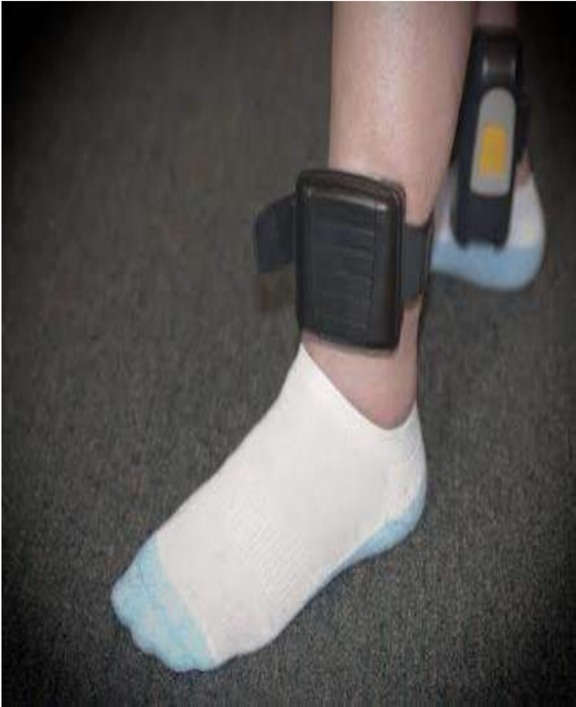
الصورة 2 الصوار الإلكتروني الذي يوضع في الرجل