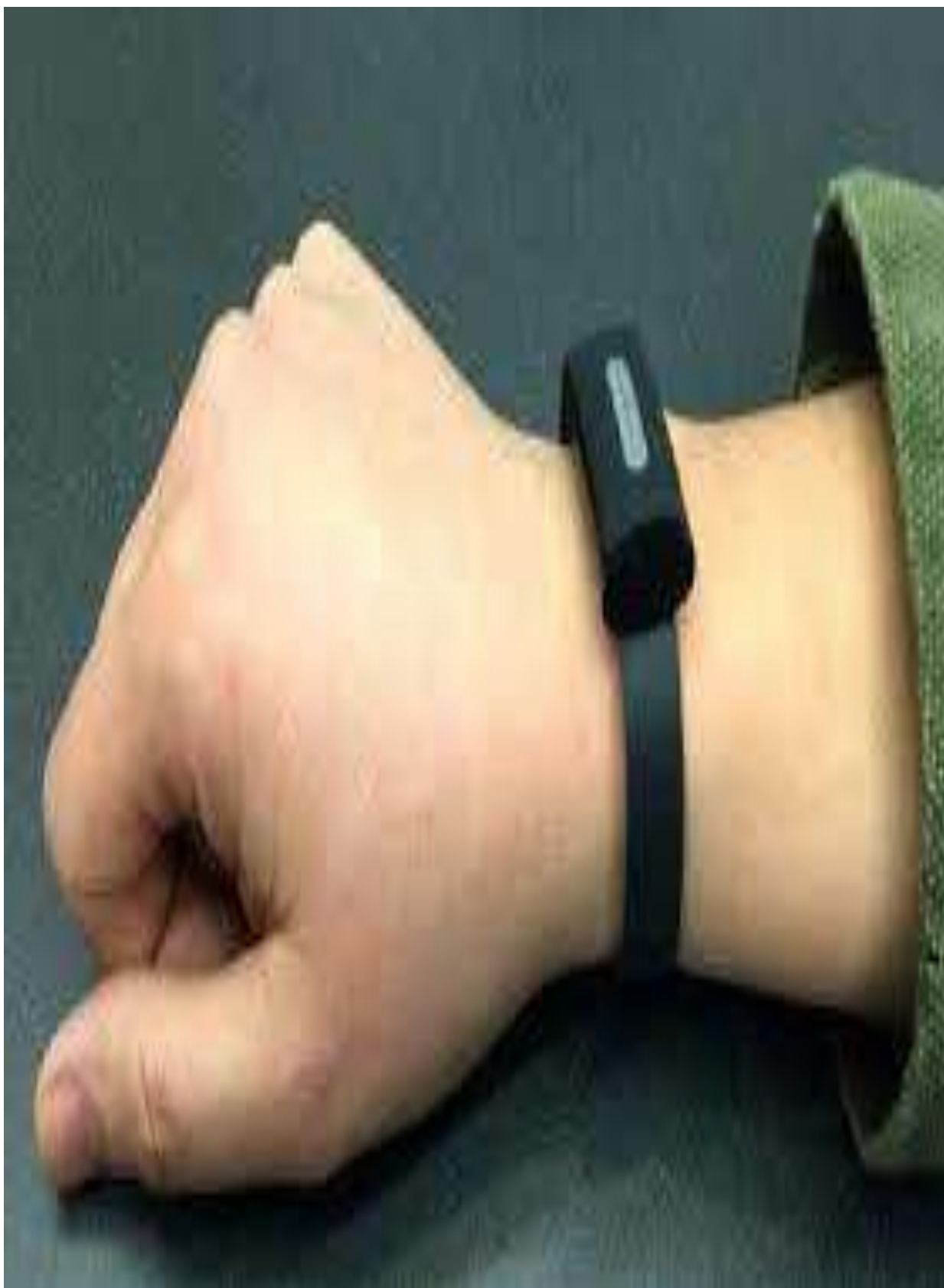
الصورة 1 السوار الإلكتروني الذي يوضع في اليد