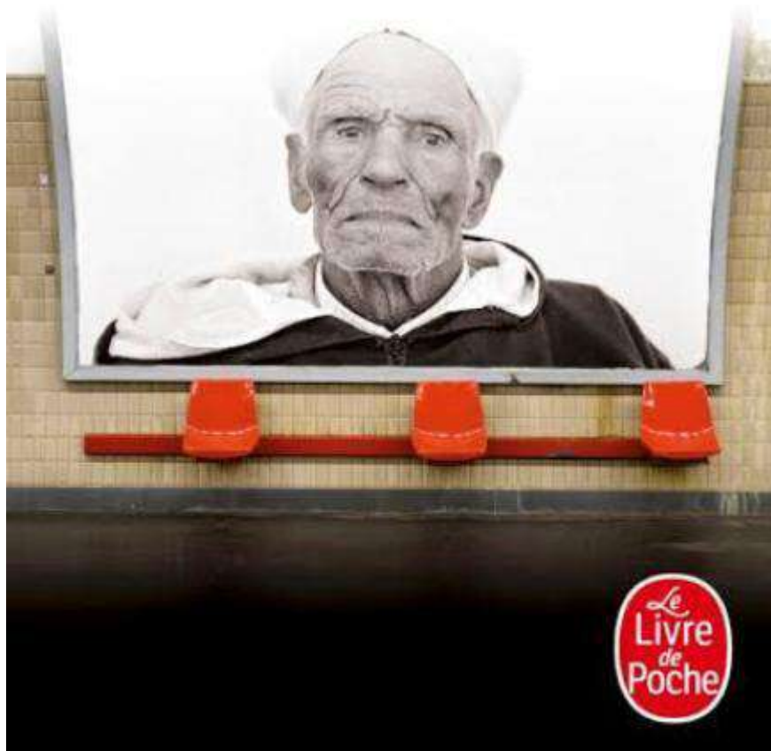
5.2 : La 4 ème de couverture