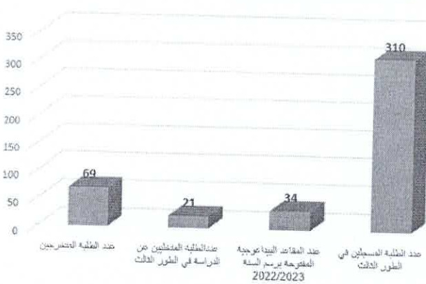
حصيلة التكوين في الطور الثالث برسم السنة الجامعية 2023/2022

وعن الترقيات المعلن عنها في شهر ديسمبر 2022 وقد عرفت جامعة عين تموشنت ترقية أربعة عشر استاذ (14) لرتبة أستاذ تعليم عالي وستة وعشرون (26) لرتبة أستاذ محاضر. وعملا بإرسال السيد الامين العام لوزارة التعليم العالي والبحث العلمي للتعليمية الرقم 1486، المتعلقة بوضع منصة رقمية لإيداع ملف مناقشة اطروحة الدكتوراه فان ادارة جامعة عين تموشنت تأكد التطبيق الحرفي للعملية بتسجيل عشرة ملفات مودعة نوقش ثلاثة منها إلى غاية تاريخنا هذا.