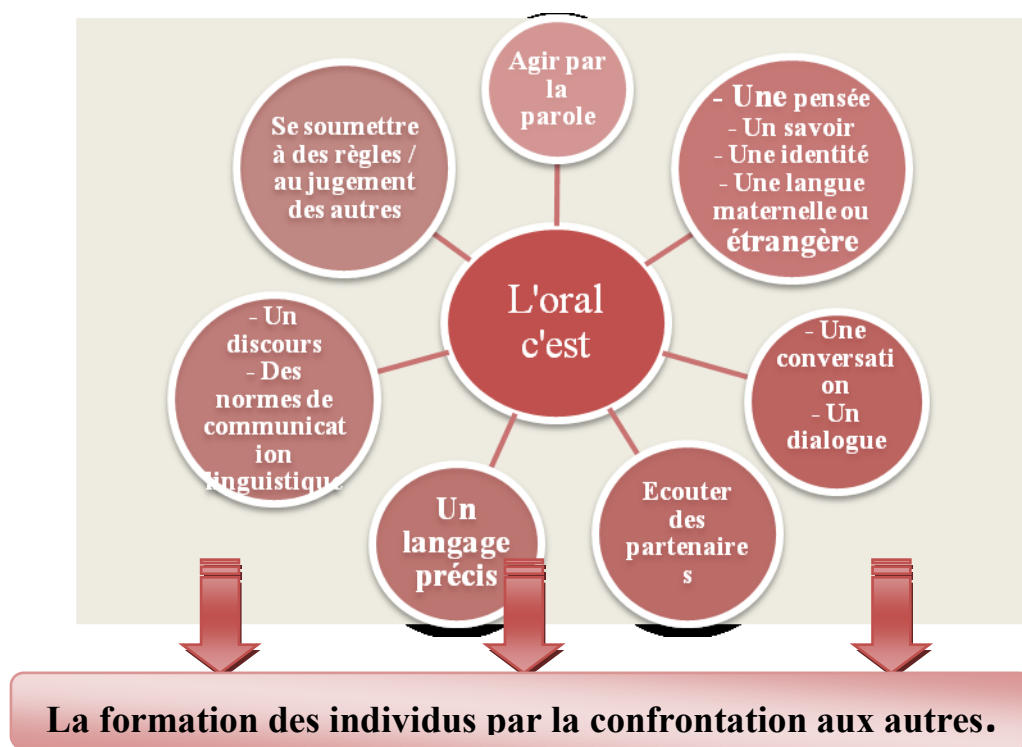
Schéma 1 : Notions de l'oral de Jean-Marc Coletta 6